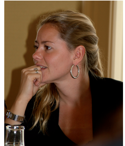
MADOLON: TYPE BLAUW

bepaalde kijk op situaties geeft. Het gedrag dat voortkomt uit deze voorkeuren bepaalt de wijze van communiceren, het nemen van besluiten, samenwerking, leidinggeven, enzovoort. Jung onderscheidt drie psychologische voorkeuren: · De wijze waarop we onze aandacht richten en onze energie tot uitdrukking brengen: extravertie en introversie. · De manier waarop we oordelen en besluiten nemen: denken en voelen. · De manier waarop we informatie tot ons nemen: gewaarwording en intuïtie.